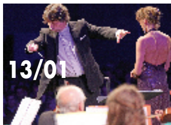
Samedi 13/01 / Musique / Orchestre Symphonique du Sud-Ouest "Concert du Nouvel An"

Dimanche 24/12 / Clown & Musique / Collectif HIHIHIF "The Geneviève & Solange christmas show !" Spectacle offert la la municipa- listé dans le cadre des animations de fin d'année