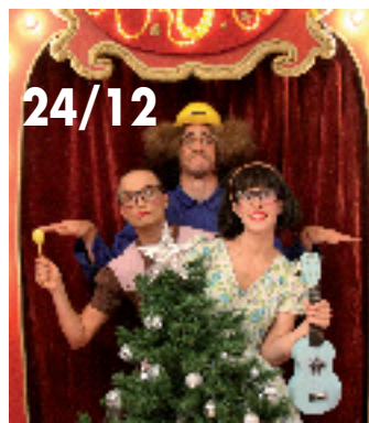
Vendredi 16/02 / Solo de Clown / Cie Microsillon "Urban et Orbitch"

UNE SAISON POUR LE JEUNE PUBLIC En concertation avec les enseignants, la ville propose une programmation culturelle pendant le temps scolaire : théâtre, contes, musique, danse, théâtre d'objet, marionnettes... Ces spectacles sont destinés aux élèves des écoles, des collèges et du lycée mais ils sont accessibles à tous, sous réserve de places disponibles, au tarif de 5 euros (pour les horaires, se renseigner au centre culturel).