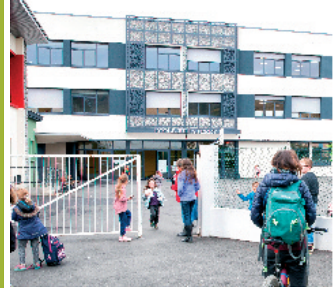
L'école Jules Ferry réaménagée