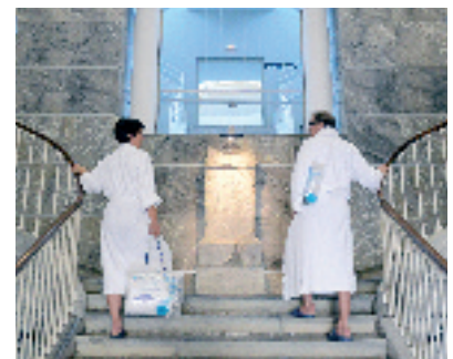
Grands Thermes Fréquentation en hausse