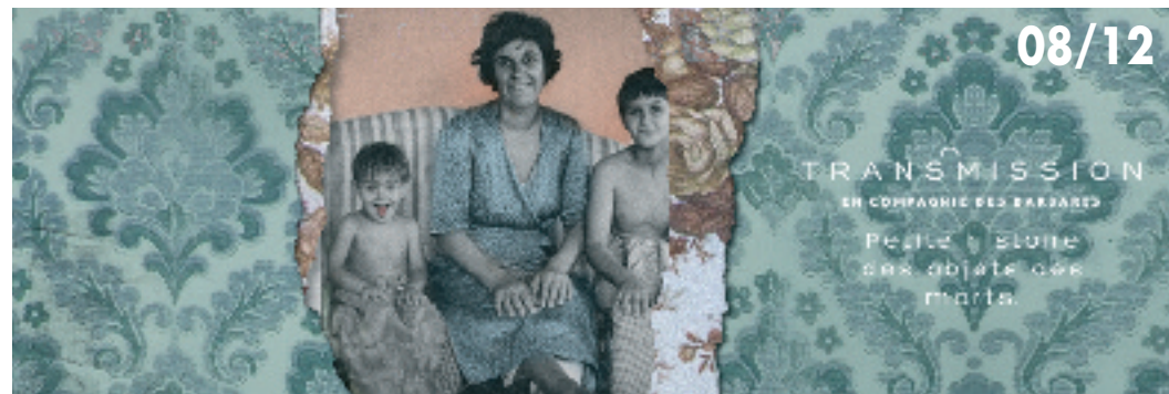
Vendredi 08/12 / Théâtre / Cie "En Compagnie des Barbares" "Transmission, petite histoire des objets morts"

La saison culturelle 2017/2018 se poursuit avec des spectacles aussi variés qu'étonnants : du théâtre-clown, de la musique classique, des bulles poétiques, du théâtre, des contes, de la "danse des signes" et bien sûr la désormais traditionnelle "soirée humour". Venez ouvrir grand vos yeux et vos oreilles !