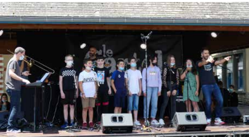
Un grand bravo au Cartel Bigourdan pour son travail d'éducation artistique auprès des élèves de 5 ème du collège Blanche Odin. Menés par les artistes du KKC Orchestra, en collaboration avec les professeurs de musique et de français, des ateliers mêlant écriture de textes et composition musicale ont permis aux élèves de réaliser leurs propres chansons. Des œuvres originales très réussies qu'ils ont présentées sur scène à tous les élèves du collège le jour de la Fête de la Musique ! Plus d'infos : www.lecartelbigourdan.fr

Claude Cazabat Maire de Bagnères-de-Bigorre 1 er Vice-Président de la CCHB