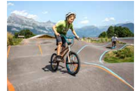
Pumptrack de Combloux (Haute-Savoie)

Un pumptrack va être aménagé sur l’ancien site de la Rocamat, au bord de l’Adour, avant la fin de l’année.