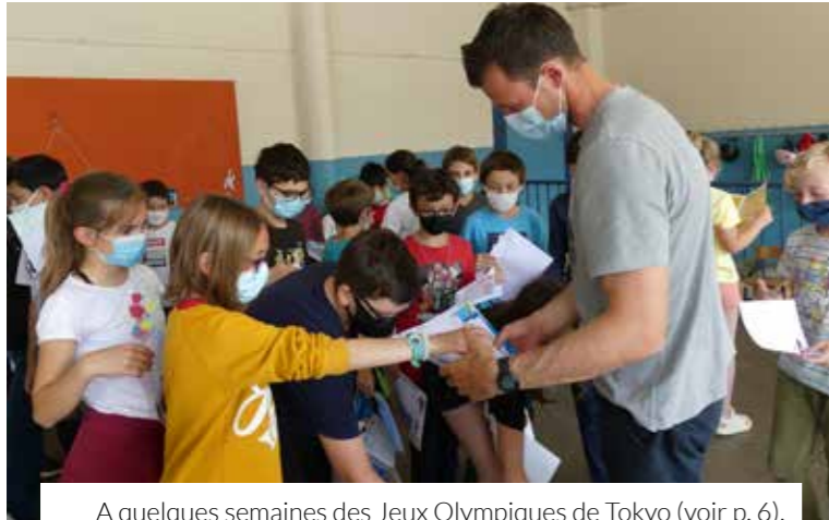
A quelques semaines des Jeux Olympiques de Tokyo (voir p. 6), Boris Neveu est venu rencontrer les élèves de CM1 et CM2 de l'école Carnot, établissement qu'il a lui même fréquenté au même âge. Après un temps d'échanges avec des enfants très curieux de découvrir son quotidien d'athlète de haut niveau, le champion du monde bagnérais a reçu leurs encouragements sous forme de dessins et ravi ses jeunes supporters par une séance de dédicaces. #TousderrièreBoris !