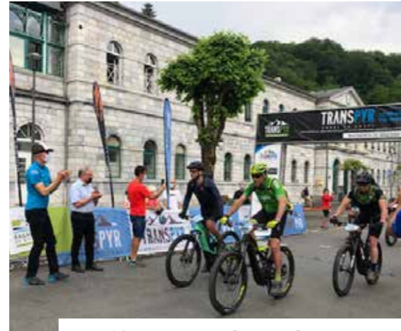
Le raid VTT Transpyr Coast to Coast, traversant la chaîne pyrénéenne depuis Saint-Jean-de-Luz jusqu'à Rosas, a fait escale à Bagnères les 15 et 16 juin. Une épreuve hors du commun en 7 étapes, soit près de 1000 km de sentiers de montagne et plus de 20 000 m de dénivelé positif cumulé !