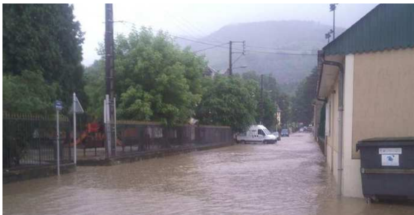
La rue Prosper Noguès sous les eaux en juin 2010.

- l'école de vos enfants qui vous prévient de l'activation de son Plan Particulier de Mise en Sécurité et vous demande de ne pas venir le(s) chercher car leur sécurité est assurée.