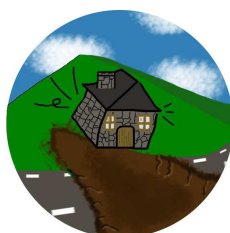
Mouvement de terrain